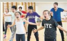
Tanz & Kunst Königsfelden.