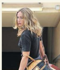
Cécile de France als Carole.