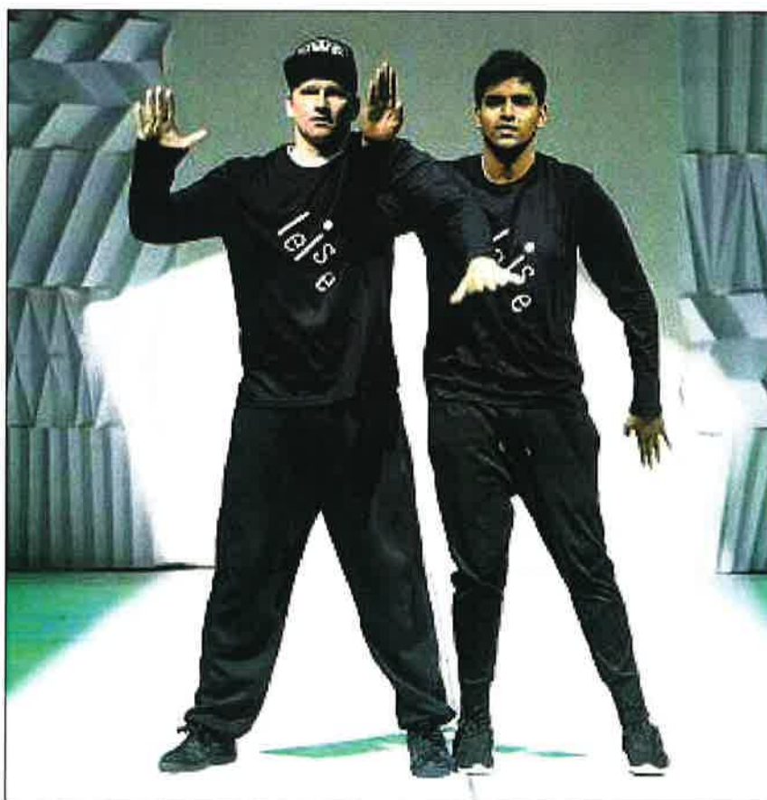
Performance mit HipHop-Weltmeister Patrick Grigo (links)

Themen-Nr.: 836.005 Abo-Nr.: 836005 Seite: 11 Fläche: 48'635 mm 2